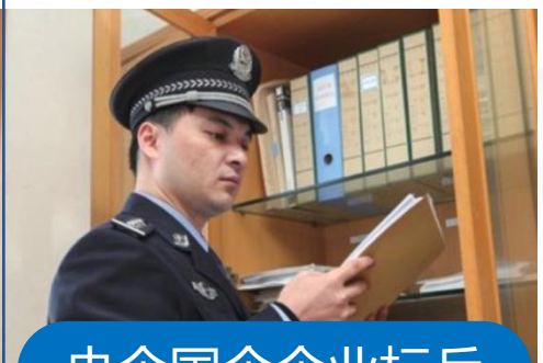
央企国企企业标兵