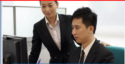
党政机关优秀党员